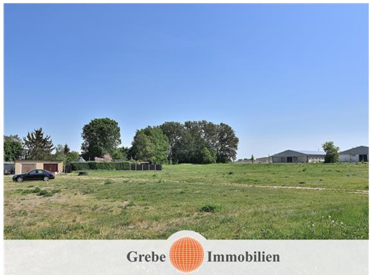
4.300,00 qm Grundstück