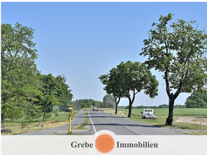
Direkte Anbindung B 101